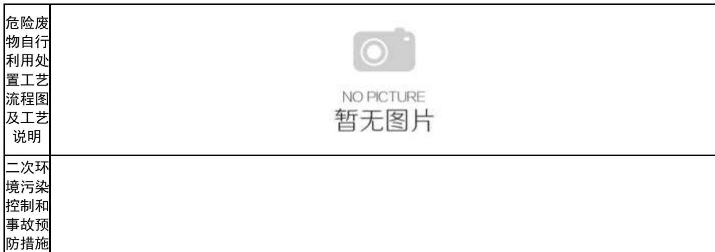
表 7 危险废物委托利用/处置措施（可另增页）