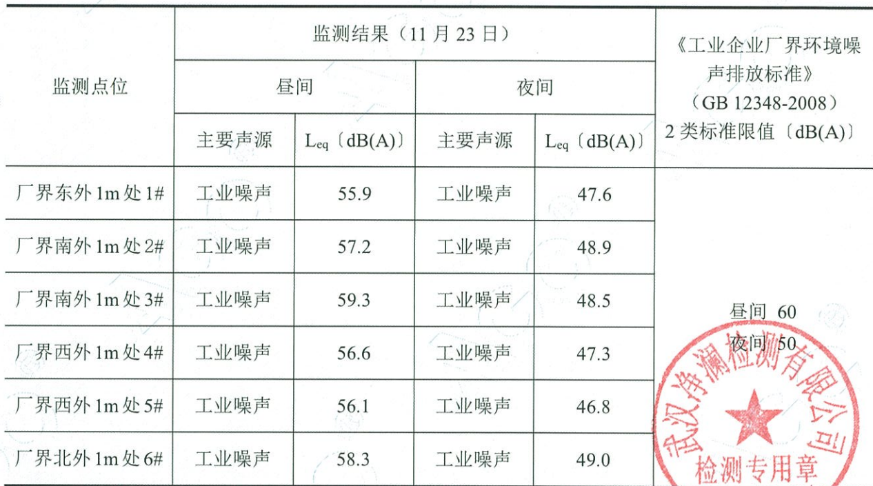
表 4-3 噪声监测结果一览表

备注：11月23日天气状况：晴，风速：昼间 1.7~2.3m/s，夜间 2.0~2.7m/s。